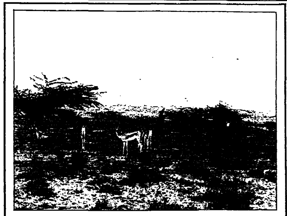
الملك فيصل الثاني يفتتح معرض الإغاثة الإسلامية بالباحة.

الملك فيصل الثاني يفتتح معرض الإغاثة الإسلامية بالباحة. الملك فيصل الثاني يفتتح معرض الإغاثة الإسلامية بالباحة. الملك فيصل الثاني يفتتح معرض الإغاثة الإسلامية بالباحة.